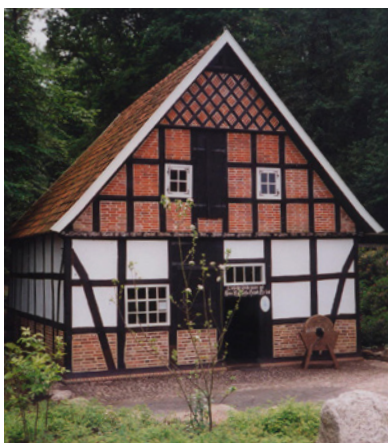
Wassermühle Höltermann, Front zur Hofseite

Die Wassermühle Höltermann ist seit dem Juni-Öffnungs-Sonntag wieder für Besucher zugänglich. Das kann bis Oktober jeweils einmal im Monat so bleiben.