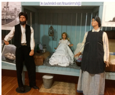
Auswandererausstellung, Nachbau Zwischen-deck, mittlere Koje

Sicher ist, dass die Sonderausstellung „US-Auswanderung im 19. Jahrhundert aus Damme“ im Stadtmuseum ab Sonntag, den 5. Juli zugänglich sein wird. Die Vorbereitungen und der Aufbau dazu liefen bereits seit Anfang Februar, wobei die Monate während