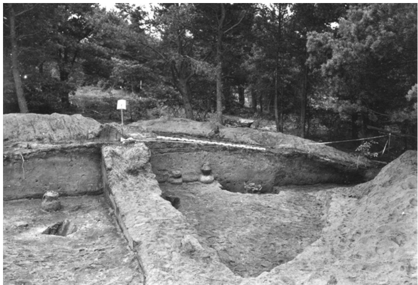
Hügel A, Quadrant 1 bis 3, Mahnenbergausgrabungen 1935