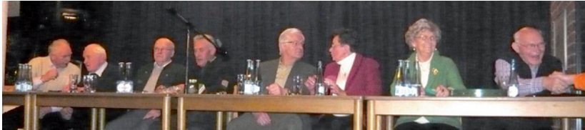
Alle Akteure vor Beginn auf dem Podium im Rathaus Damme

„Redezeit – Dütt un datt up Dammer Platt“ 10. Ausgabe