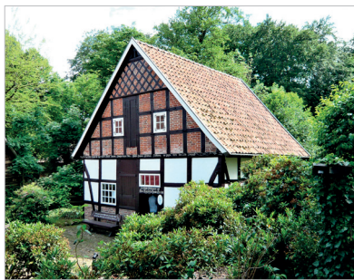
Strahlend zum 225. Geburtstag die Front der Wassermühle Höltermann

Eine Menge wissbegieriger Besucher wollte sich am Pfingstmontag aus Anlass des alljährlichen Deutschen Mühlentags nicht nehmen lassen, der Wassermühle Höltermann in Damme einen Besuch abzustatten. Am Ende nach 18 Uhr waren es närrische 111 Interessenten, die diesen historischen Ort aufsuchten, der vom Heimat- und Verschönerungsverein „Oldenburgische Schweiz“ betrieben wird. Begünstigt war der Tag von strahlendem Sonnenschein.