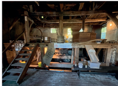
Die Mahlfläche erwartet die Besucher