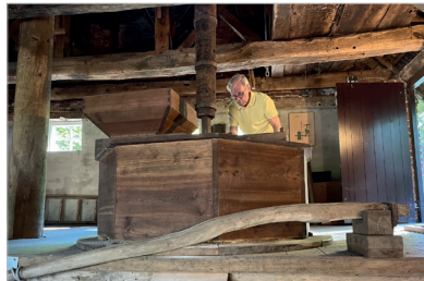
Ein Mühlenwart an der Bütt