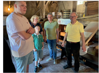
Interessierte Zuhörer an der Mehlschütte

weise verrohrte Fortsetzung des Baches durch den Ortskern sogar „Dammer Donau“ genannt hat, worauf schließlich die Bezeichnung der früheren Kuhstraße als Donaustraße entstand. Und dann – so vermittelten es die Mühlenführer – geht das Wasser ins Moor, um letztlich in Bornbach und Hunte zu fließen.